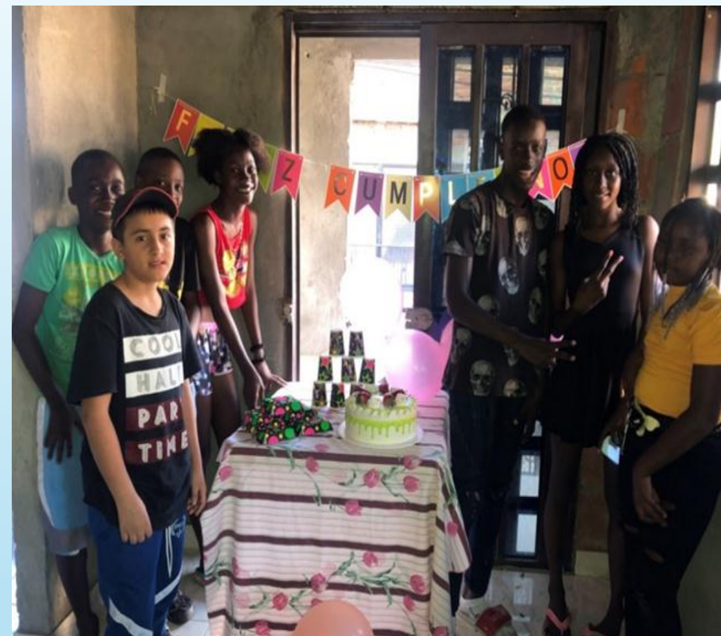
8. Niños, niñas y jóvenes celebrando el cumpleaños - proyecto de Vida. CRJFE 2021.