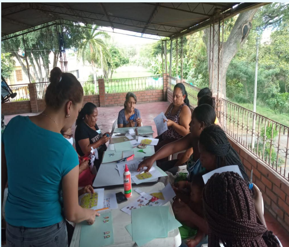
Grupo de mujeres Círculo de Paz Participando en taller de formación. CRJFE Palmira 2021