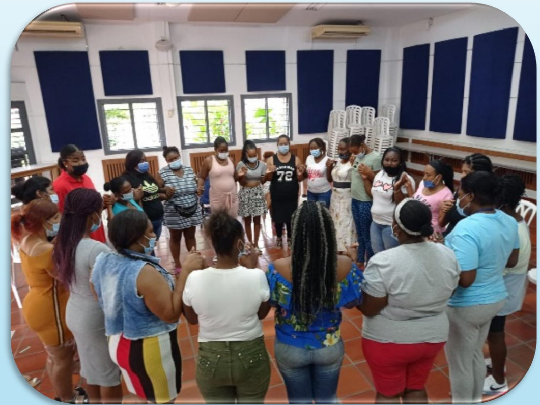
Graduación del módulo empoderamiento político— Proyecto Casas Francisco Esperanza, 14 de diciembre de 2021